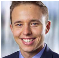
Kip Sloane rosenbaum nagy GmbH