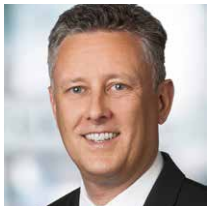
Jochen Richter Curacon GmbH